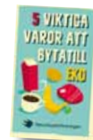
"5 viktiga varor att byta till eko" 2015 Art nr: 6191