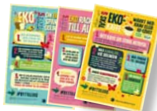
Flyer "Eko kan mätta världens fattiga" Art nr: 6168