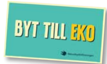
Takskylt "Byt till eko" 70 cmx40 cm Art nr: 6197