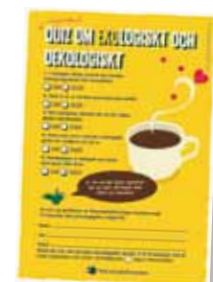
Tävlingstalong quiz om oekologiskt och ekologiskt Ny 2015. Art nr: 6213