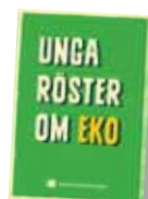
"Unga röster om eko", folder för åk 4-8. Art nr: 6192