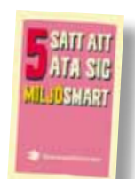
"5 sätt att äta sig miljösamt" 2015 Art nr: 6190