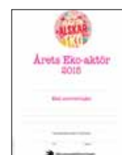
Diplom "Årets eko-aktör 2015" Art nr: 6215

Kampanjhandledning 2015 "Kampanjhandledning" med förslag och idéer på aktiviteter, insändarförslag med mera. Art nr: 6214