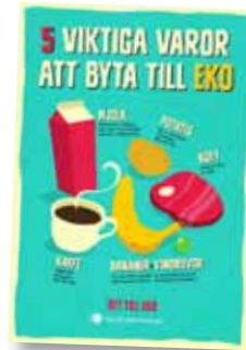
5 viktiga varor att byta till eko Art nr: 6199