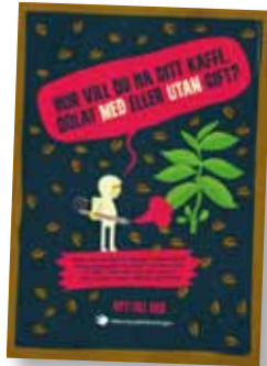
Hur vill du ha ditt kaffe? Art nr: 6210