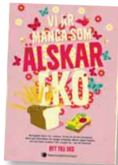
Vi är många som älskar eko Art nr: 6211