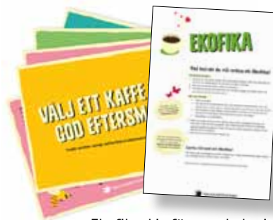
Ekofika-kit för en ekologisk fikapaus med frågekort och instruktion. Ny 2015. Art nr: 6219