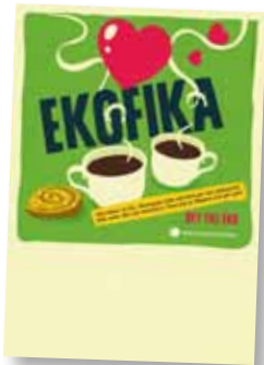
Ekofika Art nr: 6225