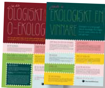
"Så här ologiskt är det med o-ekologiskt" 50x70 cm. Art nr: 6164